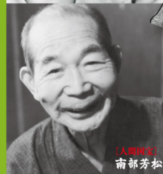
【人間国宝】南部芳松