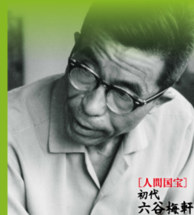
【人間国宝】初代 六谷梅軒