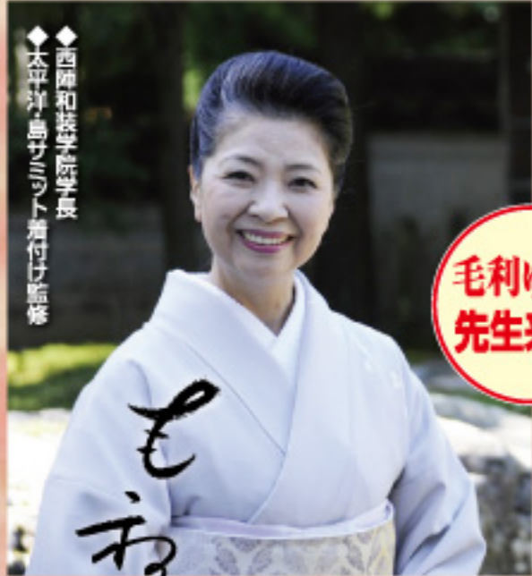
◆西陣和装学院学長兼講師 ◆日本洋装アカデミー副学長兼講師