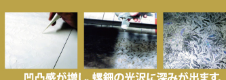
凹凸感が増し、螺鈿の光沢に深みが出ます。

目頃のご愛顧への御礼の気持ちを込めまして、 厳選訪問着を豊富にご用意致しました。