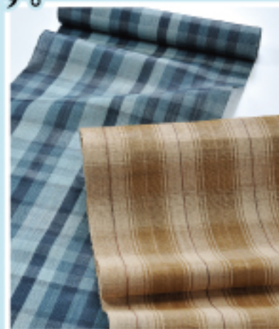
宮古島 宮古上布 みやこじょうふ 400年前に起源を さかのぼる