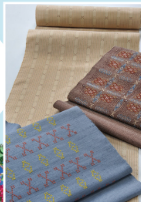
読谷山 花織 ゆんたんざはなおり 幾何学模様で 花のような美しさに