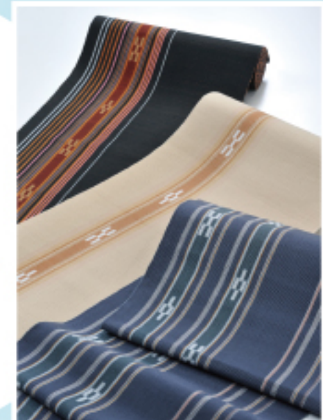
石垣島 八重山上布 やえやまじょうふ 貢納布制度が生んだ 美しい上布