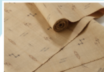
久米島 久米島紬 くめじまつむぎ 平成16年国指定 無形文化財指定