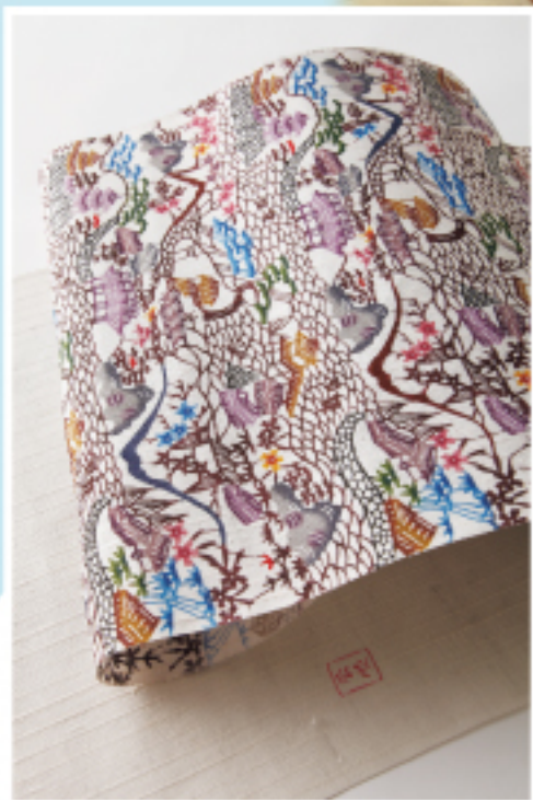
琉球紅型 りゅうきゅうびんがた 五彩が映える美しい紅型