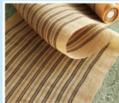
芭蕉布 ばしょうふ 沖縄の風土が 育てた織物