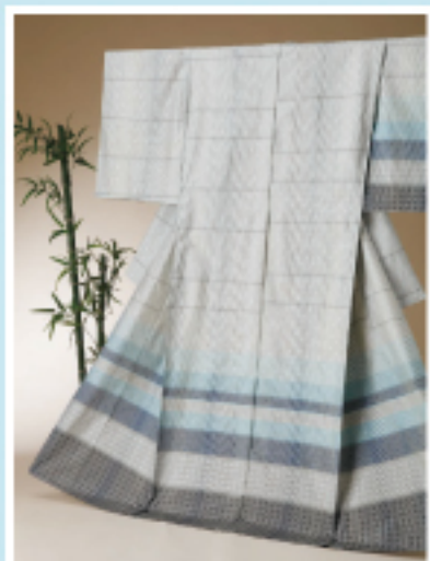
与那国島 与那国花織 よなくにはなおり 格子柄や縞柄と花織の 組み合わせ

沖縄本島から、最西端の与那国島まで、 大小いくつもの島々が連なる琉球列島。 沖縄には、日本本土全体に匹敵するぐらいの 多様な織物があります。 人の手で織りだされた、鮮やかなさまざまな布。 植物で染められた糸のやさしく力強い色。 静かに人から人へと伝えられてきた染めもの、 織りものを集めて開催します。